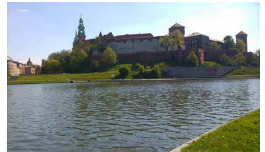
На знимці: вид на Віслу в Кракові.

Акція «Вісла» в наслідстві причынила ся до знищыня лемківского доробку поколінь та зміны культурового облича Лемковины. Польскы власти, за совітськыма взірцями, довели до примусовой польонізації і українізації Русинів з Лемковины, зліквідували лемківське шкільництво, Церков та соспільны русиньскы організації. Цілий материяльний доробок Русинів – вшыткы поля, лісы, горы, церкви, теметовы, капличкы і хыжы остали польськыма властями завлащены і такой нич з того маєтку не было потім оддане поєдным властителям. По 1989 р. част соспільного лемківского добра могла реституувати Церков, а Лемкы, Русины могли наново основати свої автономічны здружыня. ●