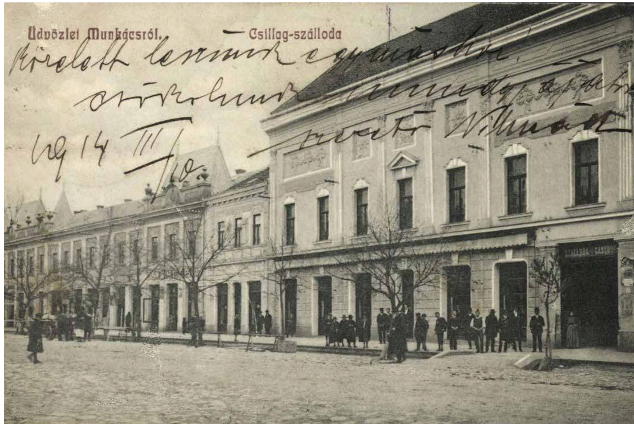
На знимці: готель та кавярня «Чіллог» в Мукачеві, почтівка з 1914 року.

Довоєнний честний кодекс Бозевича дозволял позвати на дуель не каждого, а лем тых, котры мали гонорны способности. «Честны» люде были тоты з завершеном матуром, творці і повірены до соспільных функций. Окрем них, пережитком старых часів было признаваня аристократів за «честных». Не думам, жебы свій гонір мали лем выбраны. Сохранили свою чест може каждый. Продержавных мужів, русиньскых політиків, котры діяли бы пронаційональні, все треба. Бракує лем такых, котры так важыли бы собі слово, програм і реалізуваны планы, же для сохраниня свойой особистой чести або придут до функции, або... абдикуют, коли самы признают, што для группы ест тото потрібне. Русиньській statesman фурт ест потрібний. ●