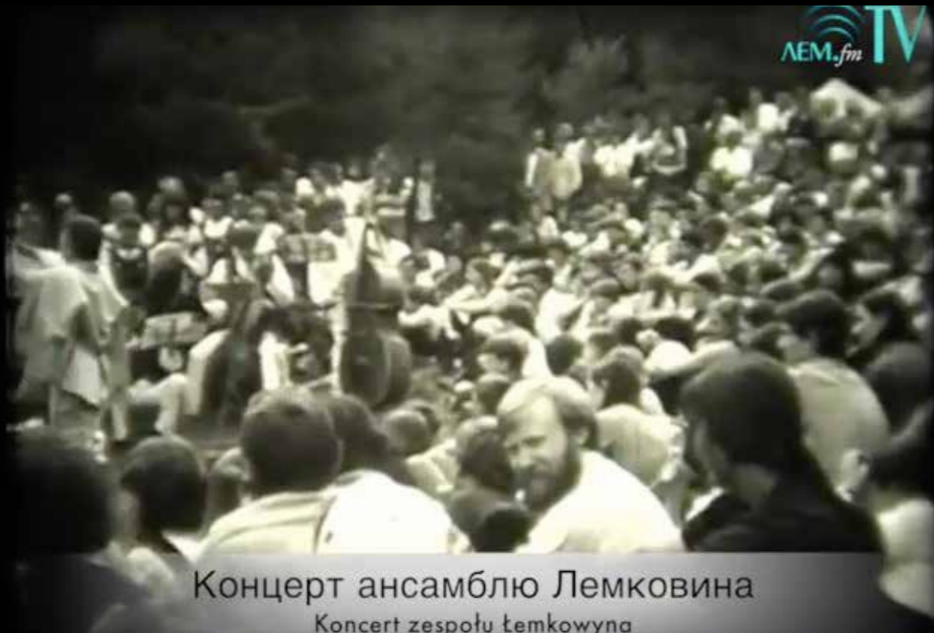
Концерт ансамблю Лемковина Koncert zespołu Łemkowyna

Просиме до обзераня фільму з 2. Лемківской Ватры в Чарній в 1984 році. Якіст запису не єст найліпша, але його дух і атмосфера проникают гет до кости. Слеза ся може тіж закрутити в оку, бо напевно вельох тых, што будут обзерати фільм, товды іщы не было на світі, а тых, што гын ся находят, тіж уж декотрых неє медже нами.